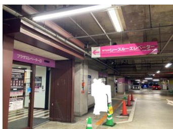
B2駐車場 シースルーエレベーターご案内